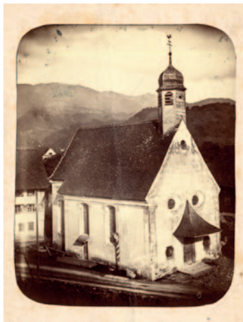
Hatler Kapelle, H. Hämmerle

Wir laden alle herzlich ein, mitzugehen.