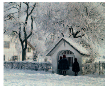
Feldrandzeichen definierten früher die Siedlungsgrenzen. Das „Zahnbild“ in Hatlerdorf stand an der Kreuzung Hatlerstraße/Schweizerstraße.

Diese Bittgänge führten entlang der Feldrandzeichen, die als Wegkreuze oder Bildstöcke die Grenzen markierten. Dort wurden für die Prozessionen Altäre errichtet und Blumenbilder gestaltet. Zu den bekanntesten dieser Marksteinzeugen zählen das „Grörerbild“ (Kreuzung Altweg/Bildgasse), das „Zahnbild“ im Hatlerdorf (Beginn der Schweizerstraße/Wallenmahd), das Pestbild im Oberdorf sowie der Bildstock an der Ecke Haselstauderstraße/Mühlegasse in Haselstauden.