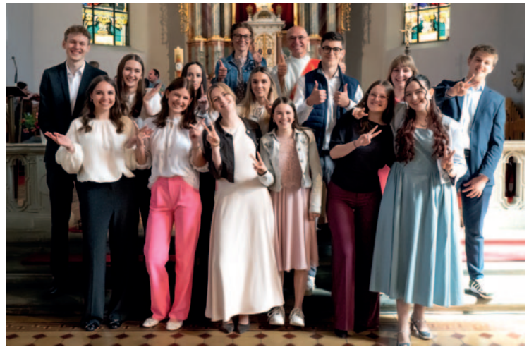
13 Jugendliche feierten in Haselstauden ihre Firmung.

Und nach dem feierlichen Teil? Da wurde weitergefeiert. Bei einer gemütlichen Agape blieb Zeit zum Reden, Lachen und Zusammensein. Firmlinge, Firmbegleiter*innen, Familien und Freund*innen ließen den Nachmittag gemeinsam ausklingen.