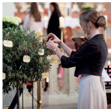
Firmung in Haselstauden