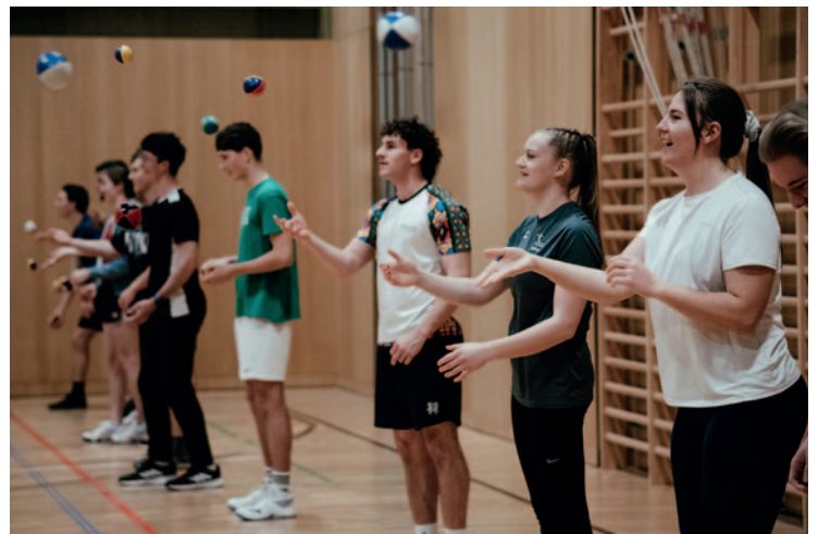
NAVIGATE, Katholische Kirche Vorarlberg