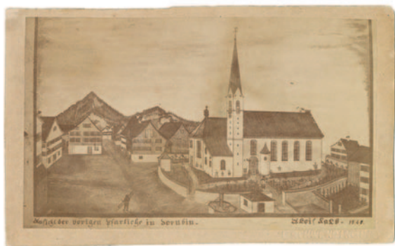
Die alte Kirche St. Martin mit dem Eingang in der Schulgasse und dem Friedhof rund um die Kirche.

Um die Entstehungsgeschichte Dornbirns rankt sich ein hartnäckiger Mythos: Die Stadt sei aus den vier eigenständigen Dörfern Markt, Hatlerdorf, Oberdorf und Haselstauden zusammengewachsen. Diese Erzählung schmeichelt zwar dem Selbstbewusstsein der traditionsreichen Ortsteile, hält jedoch der historischen Überprüfung nicht stand. Tatsächlich bildet die kirchliche Geschichte den Gegenbeweis: Über Jahrhunderte hinweg war die Pfarre St. Martin das unangefochtene geistliche Zentrum der gesamten Gemeinschaft. Hier fanden Taufen, Hochzeiten und Begräbnisse statt. Konsequenterweise lag auch der Gottesacker als zentraler „Kirchhof“ rund um die Pfarrkirche und diente als letzte Ruhestätte für Verstorbene aus allen vier „Vierteln“.