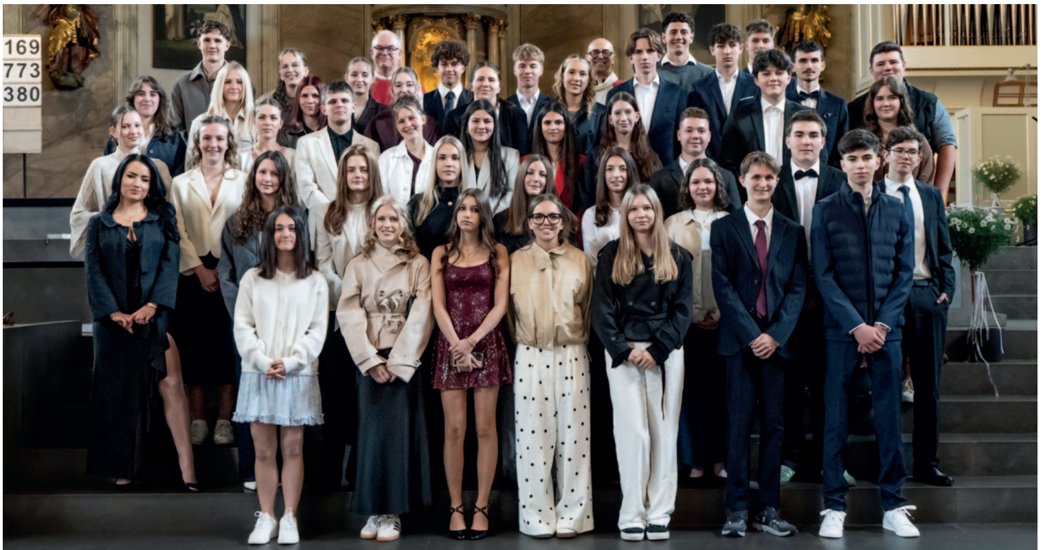
In der Pfarrkirche St. Martin empfingen 45 Jugendliche das Sakrament der Firmung.

Nach dem Gottesdienst verlagerte sich das Feiern nach draußen: Bei der Agape wurde angestoßen, geplaudert und gelacht.