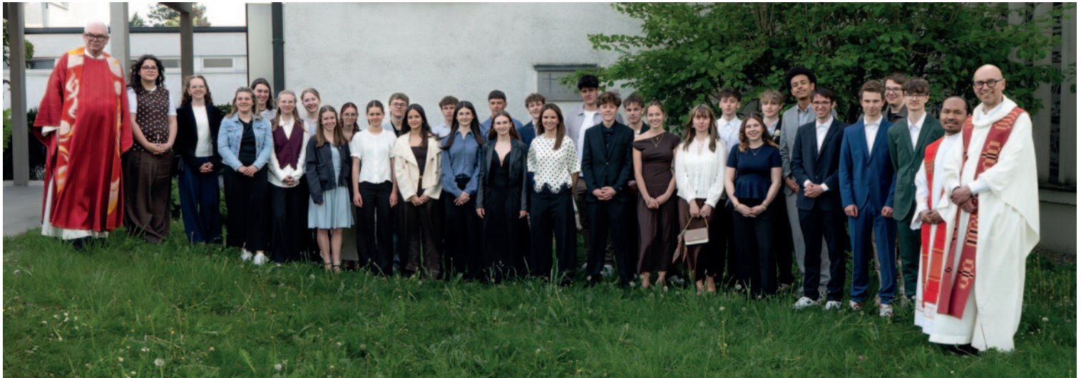
Firmung mit 30 Firmlingen in Rohrbach.